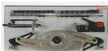
Фланец за мотоциклетни коелета