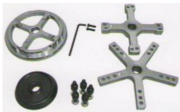
Комплект фланци за бусове