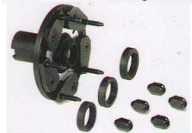
Фланец за джанти без централен отвор